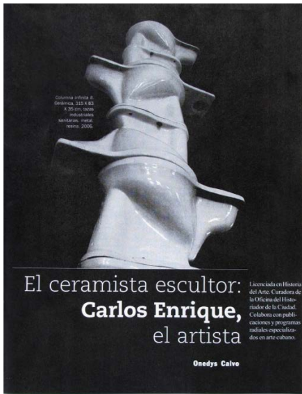
Columba infanta II Cerámica, 31,5 x 63 150 cm, 2005 Exposición personal, Caracas, 2006